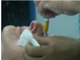
na de operatie zelf in het oog