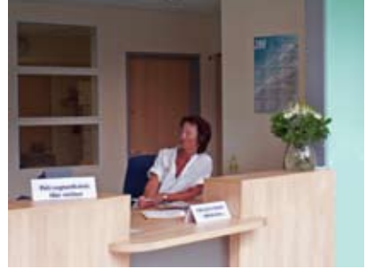
controle op de poli

Er wordt tevens een afspraak gemaakt voor de volgende dag op de poli oogheelkunde in Tiel of Culemborg.