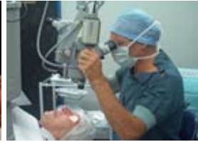
de microscoop afstellen