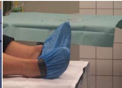
hoesjes over de schoenen