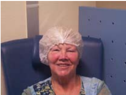
een mutsje op het hoofd

U wordt in een speciale stoel naar de operatiekamer gebracht. U zult ongeveer twee uur in het ziekenhuis verblijven.