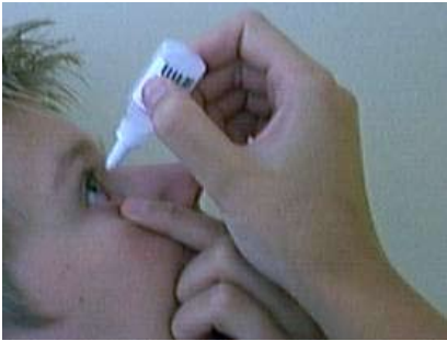
de juiste manier van druppelen

Altijd eerst uw handen wassen. Druppelen kan zittend en liggend. Trek het onderooglid iets naar beneden en kijk naar boven. Zo ontstaat er een zakje. Laat nu de druppel in het zakje vallen. Het is belangrijk dat het flesje het ooglid niet raakt om besmetting te voorkomen. Houd daarom een afstand aan van ongeveer twee centimeter. Flesjes goed schudden voor gebruik.