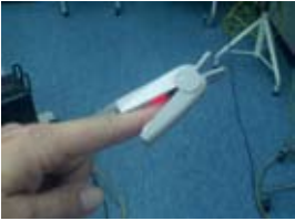
knijpertje ter controle van de hartslag

U wordt ondergedekt met steriele lakens en u krijgt verdoovingsdruppels. Tevens krijgt u verse lucht onder het laken toegediend. Het is belangrijk dat u tijdens de operatie stil blijft liggen. De apparatuur waarmee de oogarts werkt maakt af en toe piepgeluidjes. Na de operatie krijgt u zelf in het oog en wordt het oog met een oogkapje afgedekt. Het verblijf in de operatieruimte duurt ongeveer 30 minuten.