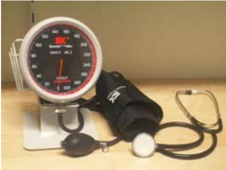
de bloeddruk wordt gemeten