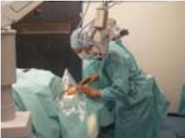
ondergedekt met steriele lakens