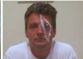
een oogdop voor het oog