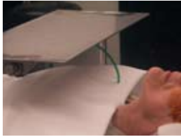
slangetje voor frisse lucht